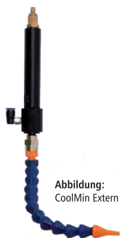
Abbildung: CoolMin Extern